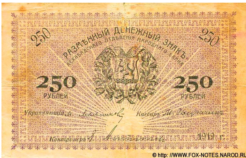
Рис. 1, 2. Аверс 10 и 250 рублевых банкнотов.