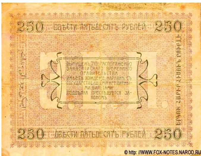
Рис. 3, 4. Реверс 10 и 250 рублевых банкнот с соответствующими надписями на армянском языке (на правой стороне).