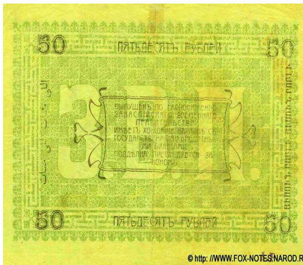
Рис. 6, 7. Реверс 5 и 50 рублевых банкнот с соответствующими надписями на армянском языке (на правой стороне).

Реверс купюр в своем центре содержит сокращение в виде больших по объему букв З.В.П., которое расшифровывается как Закаспийское Временное Правительство. Основу реверса составляют следующие предложения: “Выпущен по Распоряжению Закаспийского Временного Правительства. Имеет хождение наравне с государственными кредитными билетами. Подделка преследуется законом”. Как в аверсе, достоинство банкнотов повторяется в реверсе приведением соответствующих цифр, а именно 5, 10, 25, 50, 100 и 250. Они повторяются словами на русском, туркменском и армянском языках (транскрипция туркменских слов в квадратных скобках с применением современного алфавита добавлены автором данной статьи):