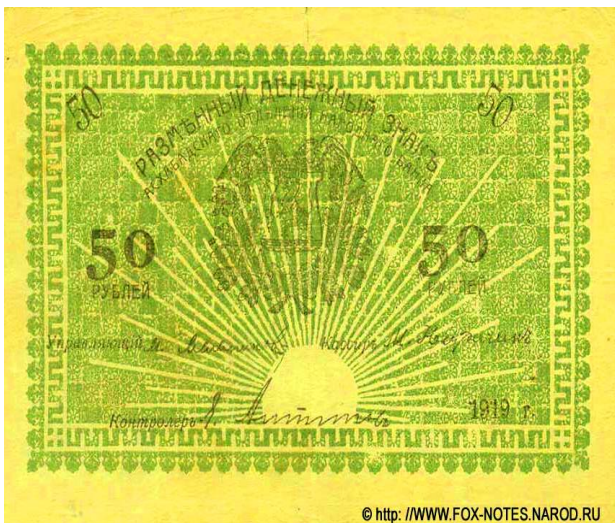
Рис. 4, 5. Аверс 5 и 50 рублевых банкнот.